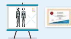
Formación continua y diplomas

En NOVASONIX te acompañamos, para que consigas tus metas, por eso ponemos a tu disposición un universo de servicios: