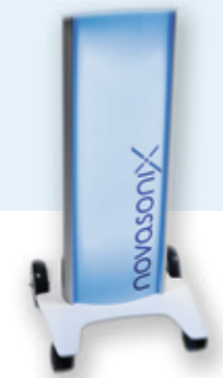
Pie retroiluminación led